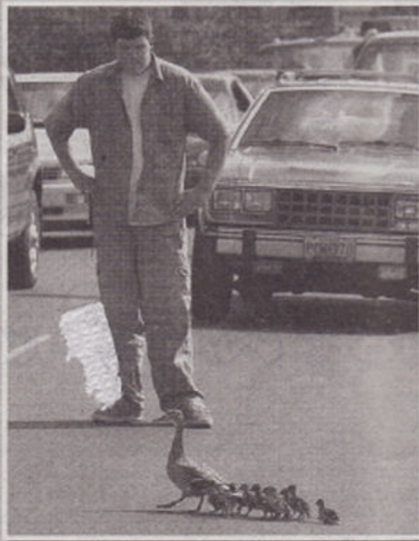
ನಮ್ಮ ಮೈ ರಾಷ್ಟ್ರಪತಿ ಕಣ್ಣೋ!