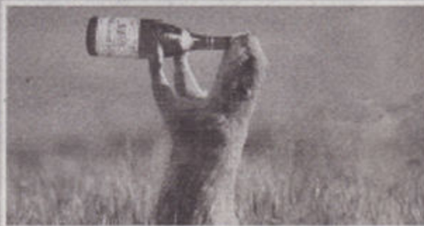
ಓ ದೇವದಾಸ! ಸೋಡಾ ಮಿಕ್ಸ್ ಮಾಡೋ!