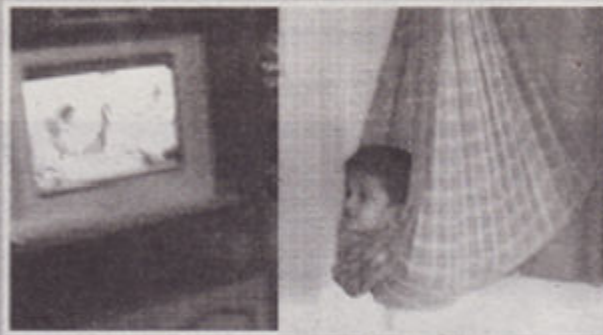
ಬಾಲ್ಕನಿ ಸೀಟೇ ಬೇಕು.